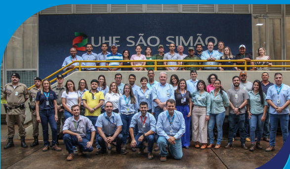
Edição Portas Abertas 2023

Em 2023, a UHE São Simão comemorou 45 de história, cinco deles sob o comando da SPIC Brasil, com ações especiais. Confira alguns desses momentos!