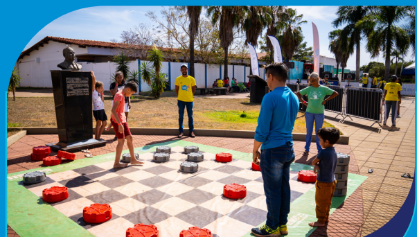
Brincando na Praça 2023

Evento “Portas Abertas” reuniu representantes da comunidade na UHE para apresentar detalhes da operação, iniciativas e investimentos.